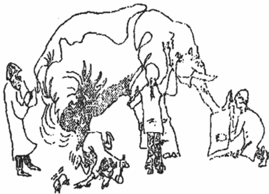
图 1-2 摸象图

一个有4位知识渊博的心理学家组成的小组来看一只大象（图1-2）。他们的方法都是盲目的。一位精神分析信徒直来到大象的身后，看着选定的部位，解释大象的行为。行为主义者去敲大象的膝盖骨，被踢得老远。他坐在那里，为小象设计一个建设性的强化方案。认知心理学家开始哄大象做什么，好确定它的发展阶段。人本主义者抚摸大象的耳朵，试图让大象相信他会飞。